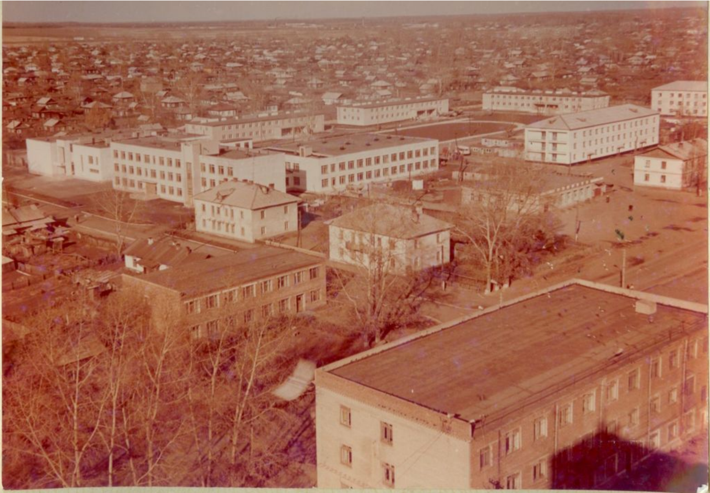
Общий вид застройки Профтехучилища на 480 учащихся