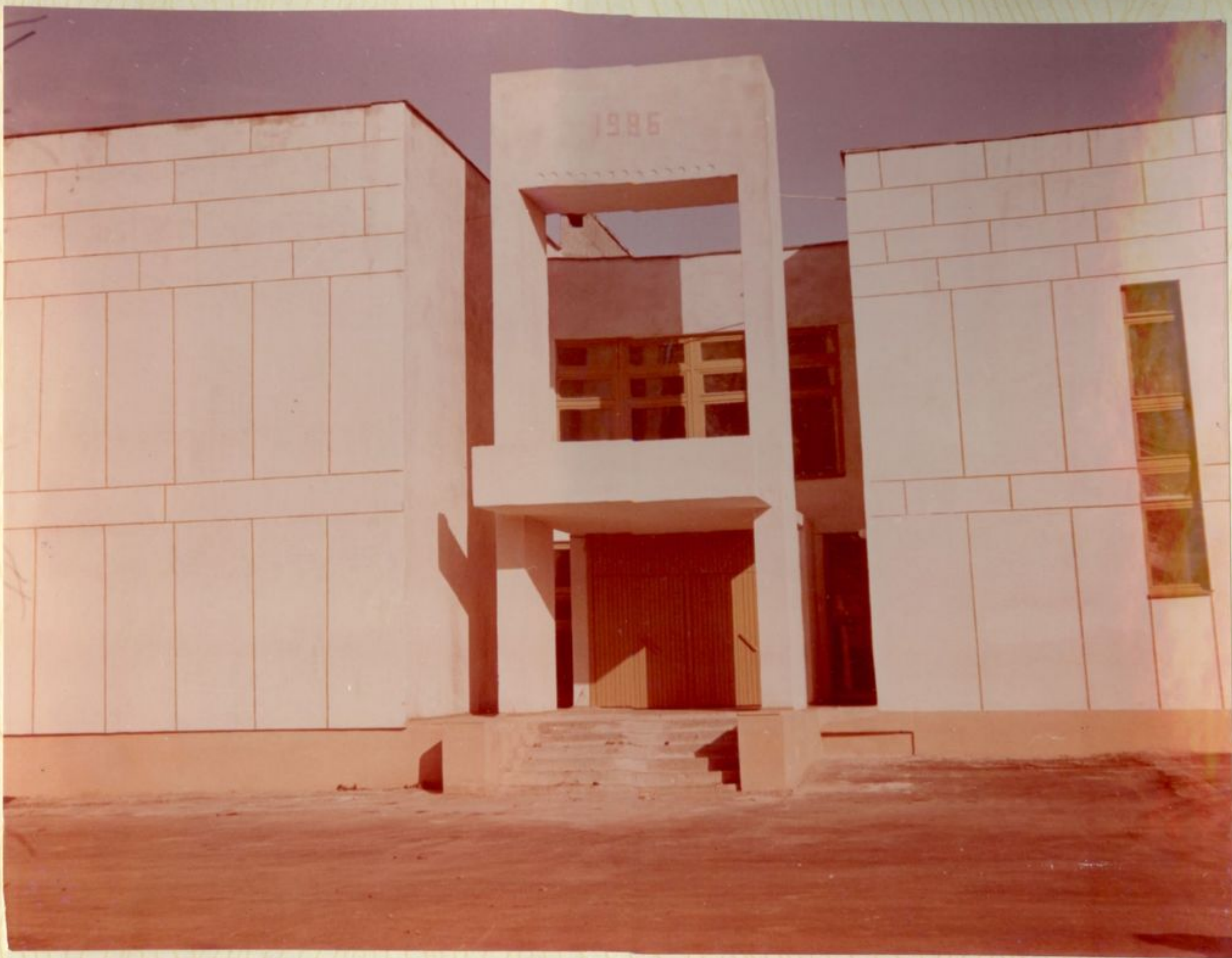
ГЛАВНЫЙ ВХОД В ОБЩЕСТВЕННО-БЫТОВОЙ КОРПУС.