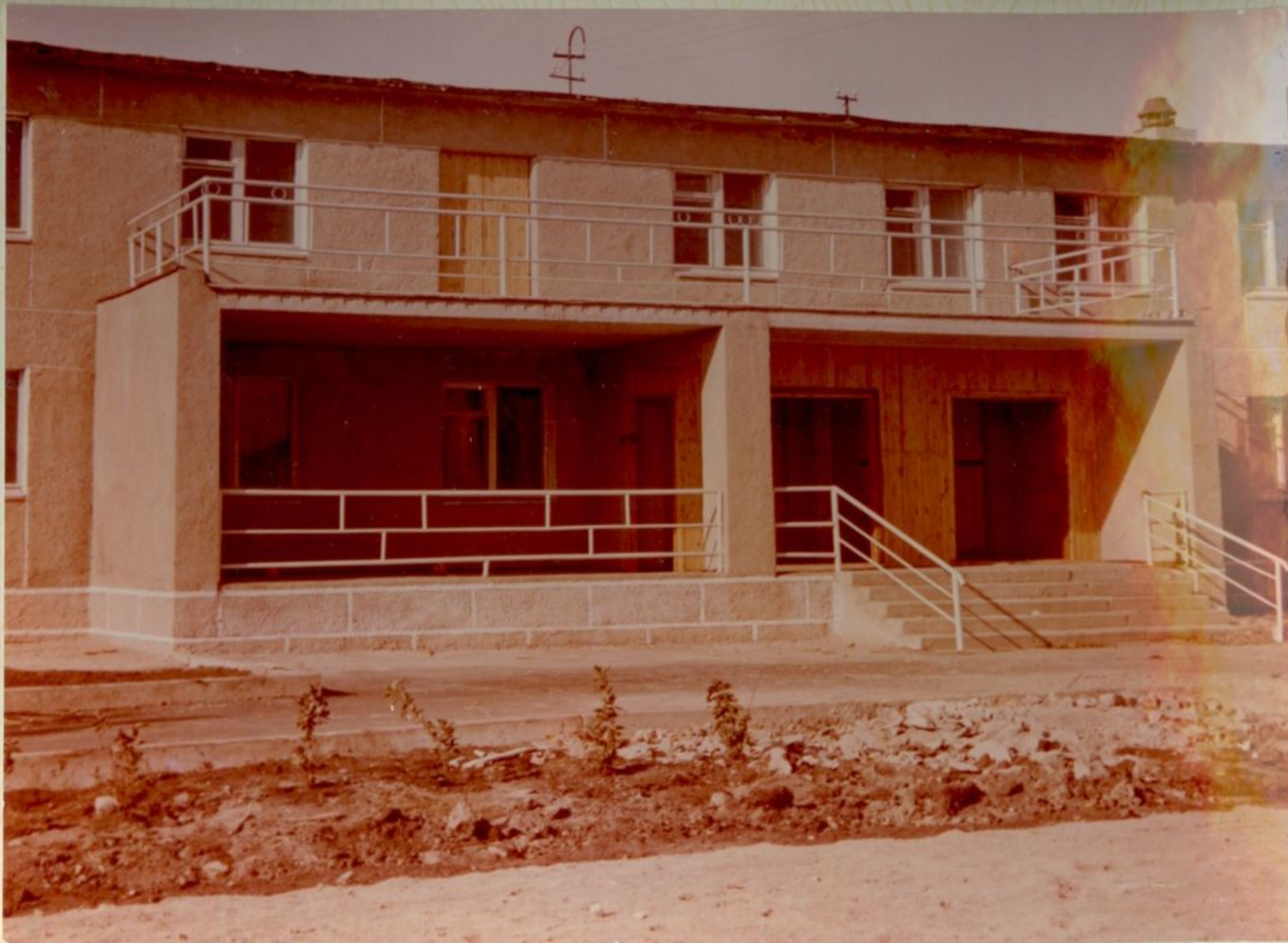
Главный вход спального корпуса.