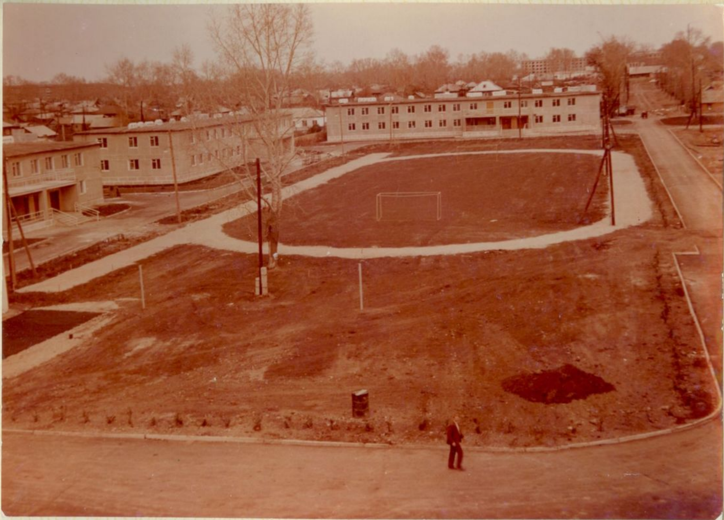
ПЛОЩАДКА ДЛЯ ЗАНЯТИЙ ФИЗИЧЕСКОЙ КУЛЬТУРОЙ.